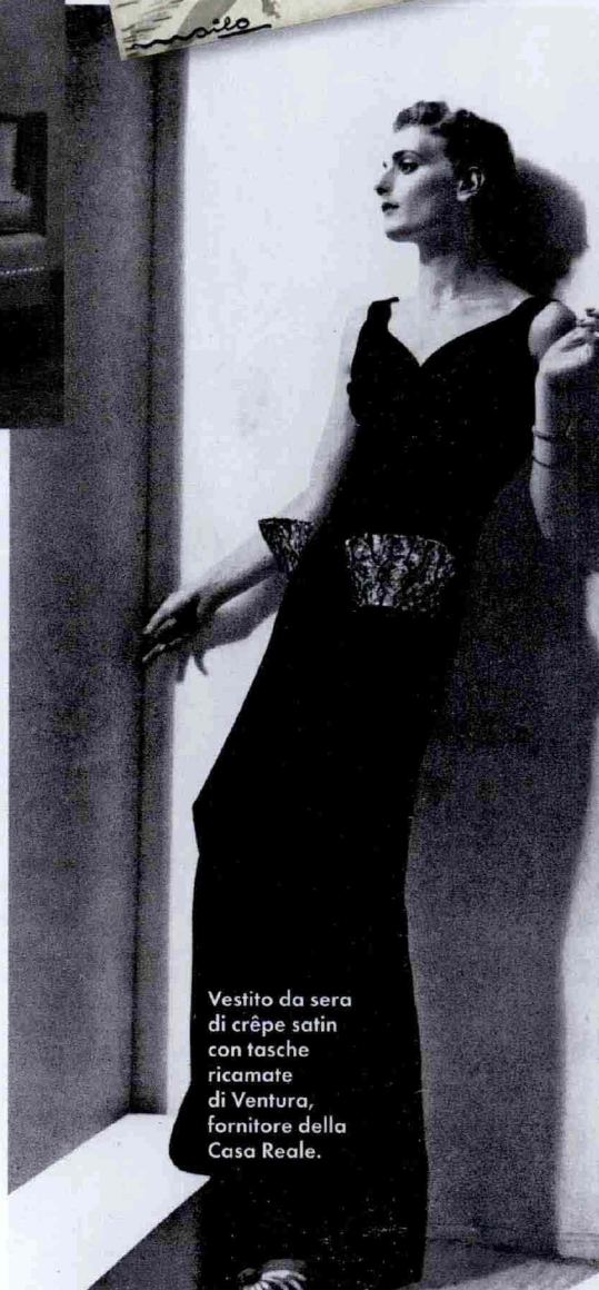
Vestito da sera di crêpe satin con tasche ricamate di Ventura, fornitore della Casa Reale.