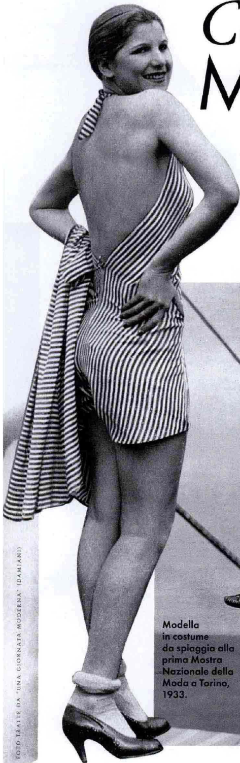
Modella in costume da spiaggia alla prima Mostra Nazionale della Moda a Torino, 1933.

Pagina pubblicitaria della compagnia di navigazione Lloyd Triestino apparsa su L'illustrazione italiana , 1933.